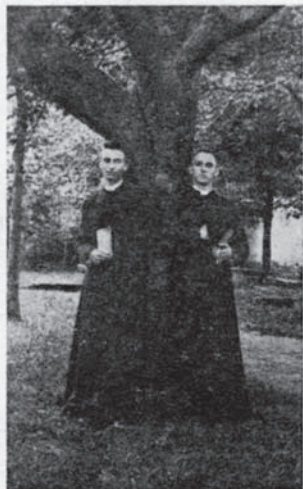
Sošolca bivša gojenca kot prefekta četrtletnika (1901 - 1902)