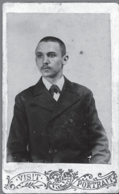
Maturant - abiturient (Trst, 1898)