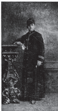
Marinekurat in Parade (golla)

Spomin na c. in kr. a. o. vojno mornarico (1914 - 1918)