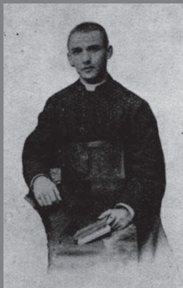
Novomašnik - Nova maša v Ospu. 21. julija 1901