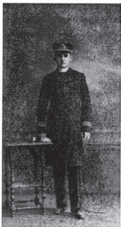
Marinekurat im Flottenrock.

Spomin na c. in kr. a. o. vojno mornarico (1914 - 1918)