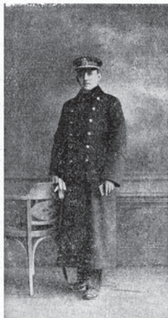
Marinekurat im Mantel

Spomin na c. in kr. a. e. vojno mornarico (1914 - 1918)