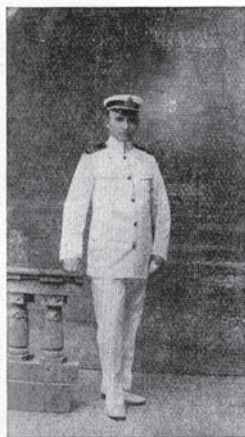
Marinekurat in Sommerbordadjutienung.

Spomin na c. in kr. a. o. vojno mornarico (1915 - 1918)